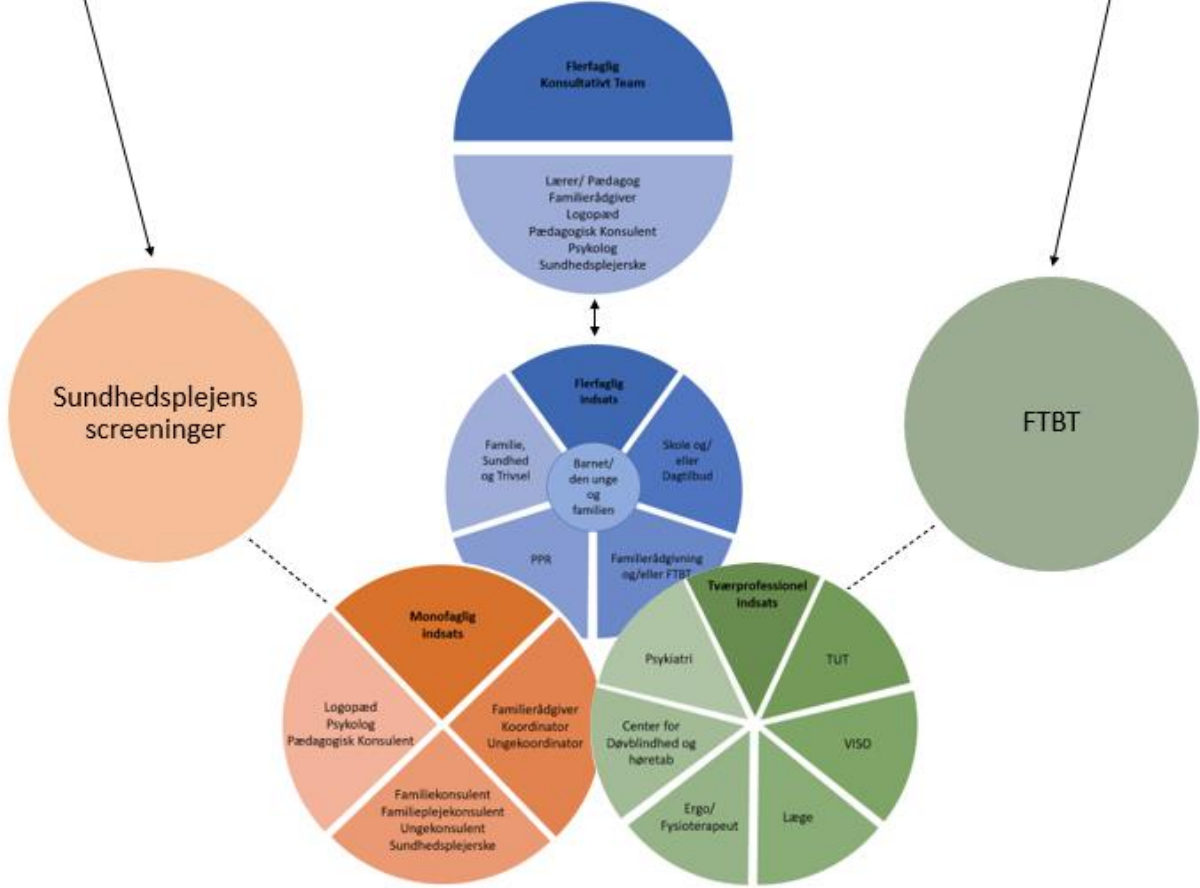
Figur 1: Morsømodellen